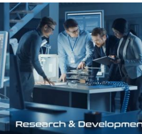
Research & Development

Het ontwerpen van innovatieve elektronica