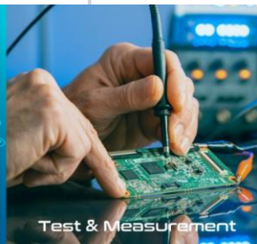
Test & Measurement