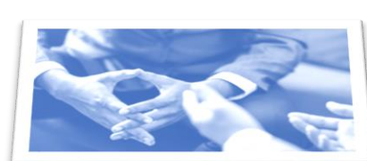
Interactie tussen branches